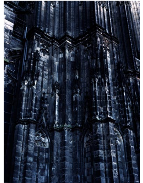
Black Churches, 2007 Photographies couleur, 120 x 160 cm