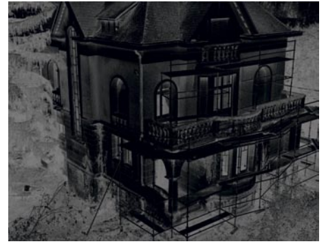
Black Houses, 2006 Photographies couleur, 108 x 85 cm