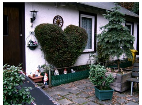
Bad Ems, 2007 Photographies couleur, 108 x 85 cm et 44 x 33 cm