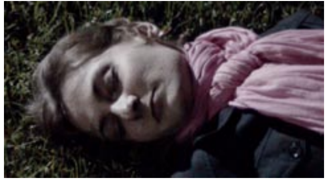
Estrella, 2006, vidéo couleur, 3'18