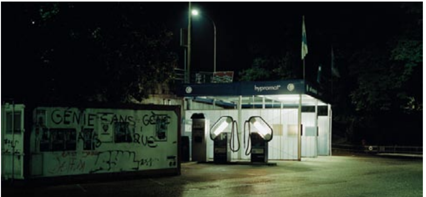
Sans titre, 2002, photographie couleur, 60 x 42 cm