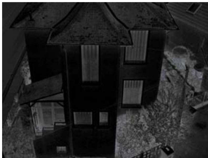
Black houses, 2006, photographie couleur, 105 x 82 cm